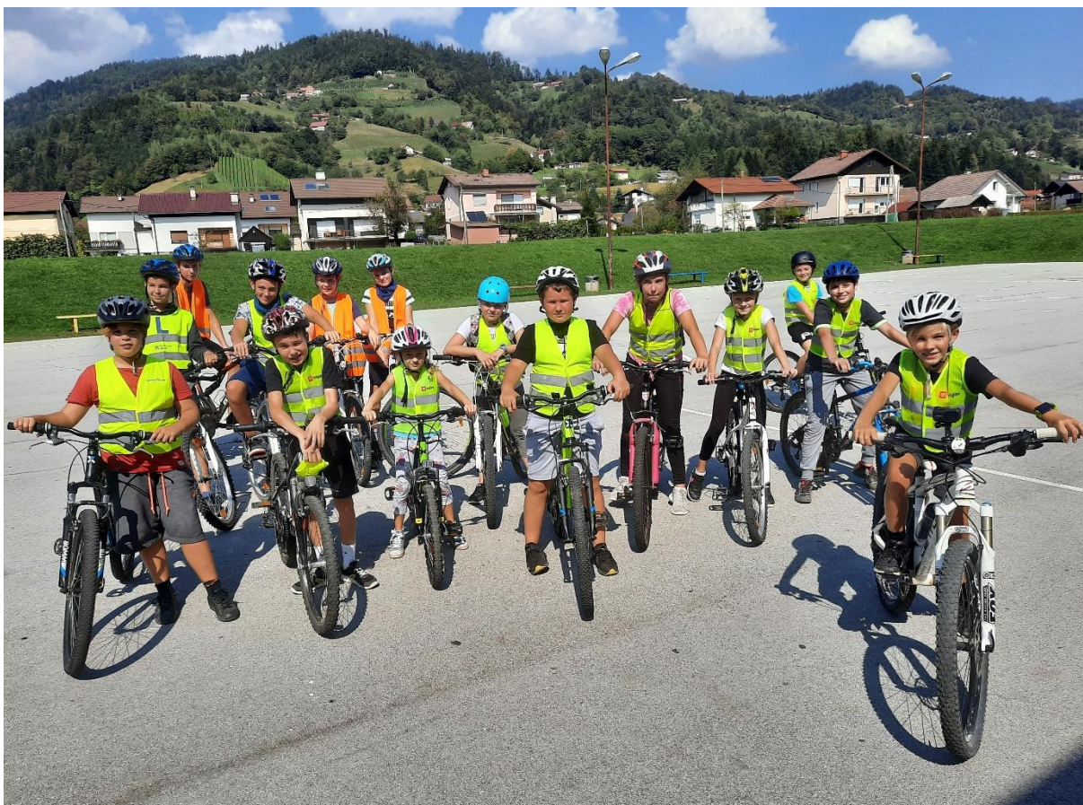
Slika 1: Skupina Varna pot vsepovsod