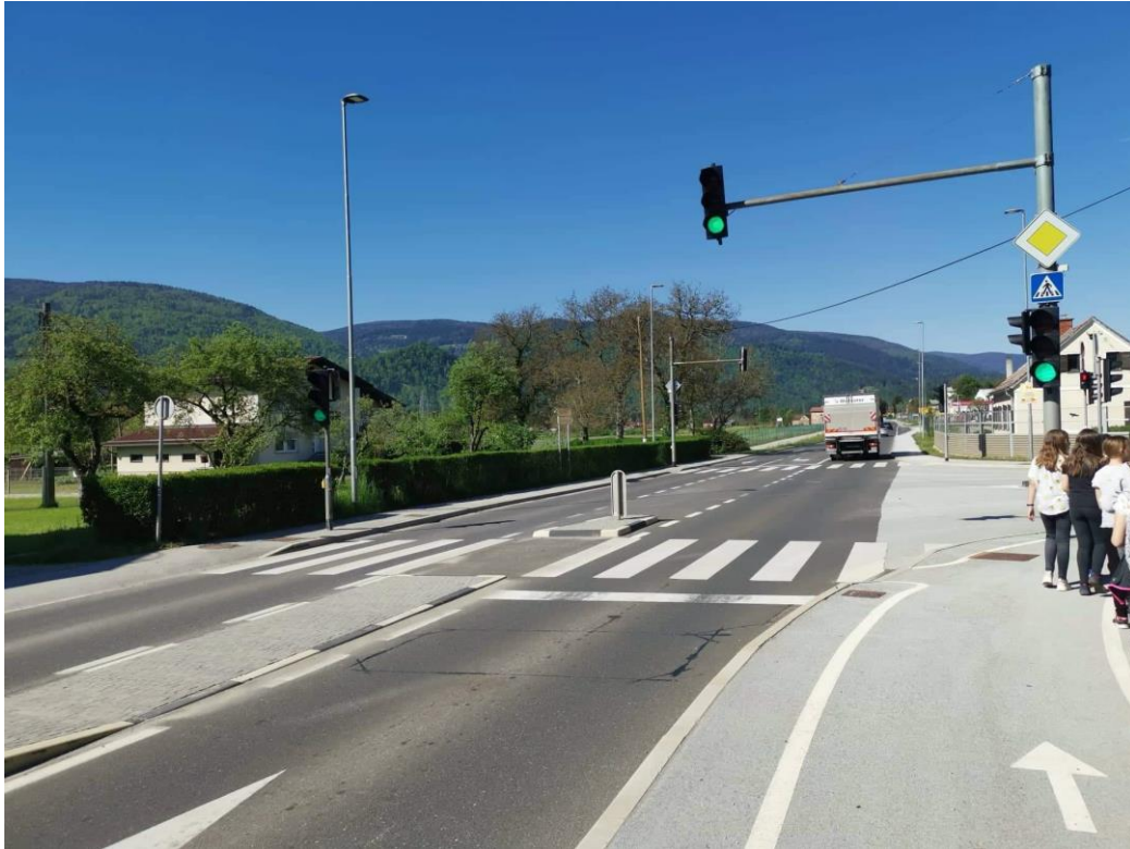
Slika 3: Kolesarska steza ob glavni magistralni cesti Maribor–Dravograd.