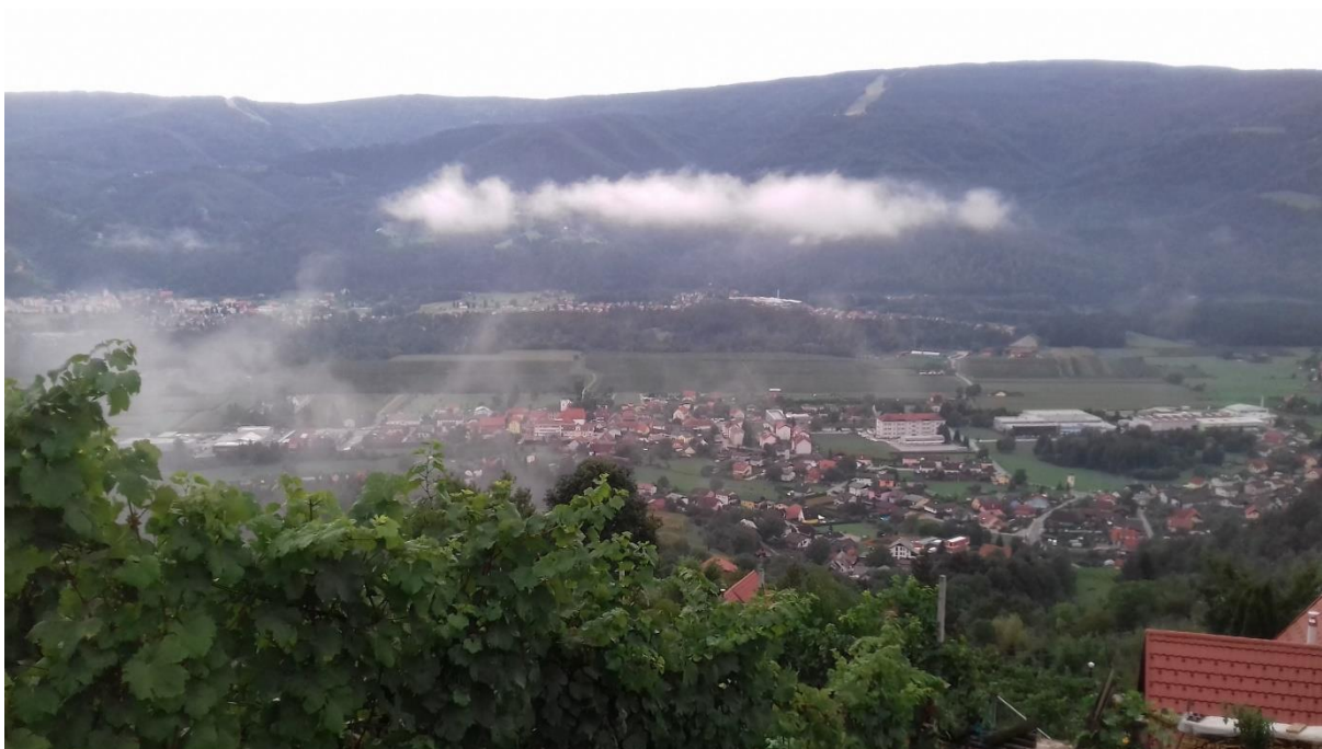
Slika 2: Selnica ob Dravi