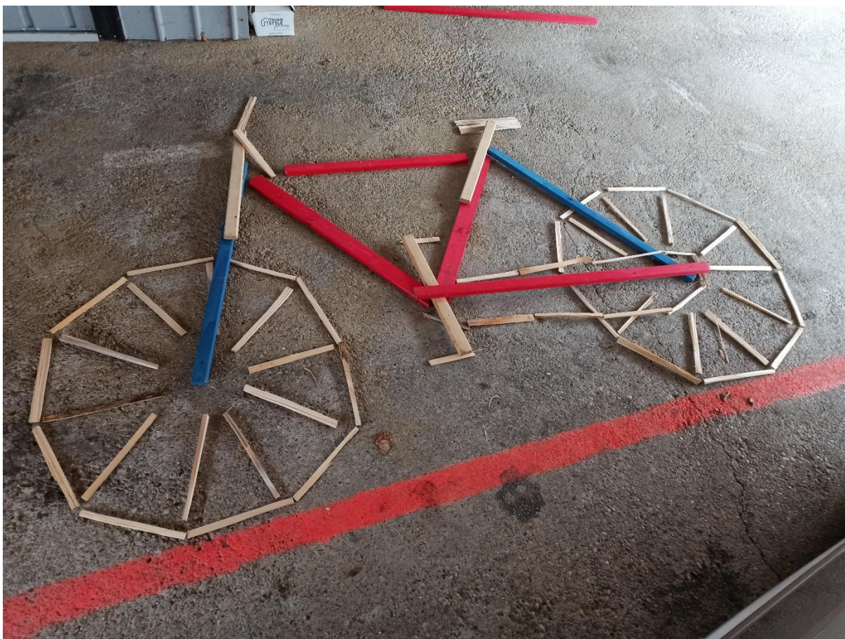
Slika 10: Kolesarka inštalacija (avtor Nik Jaunik)