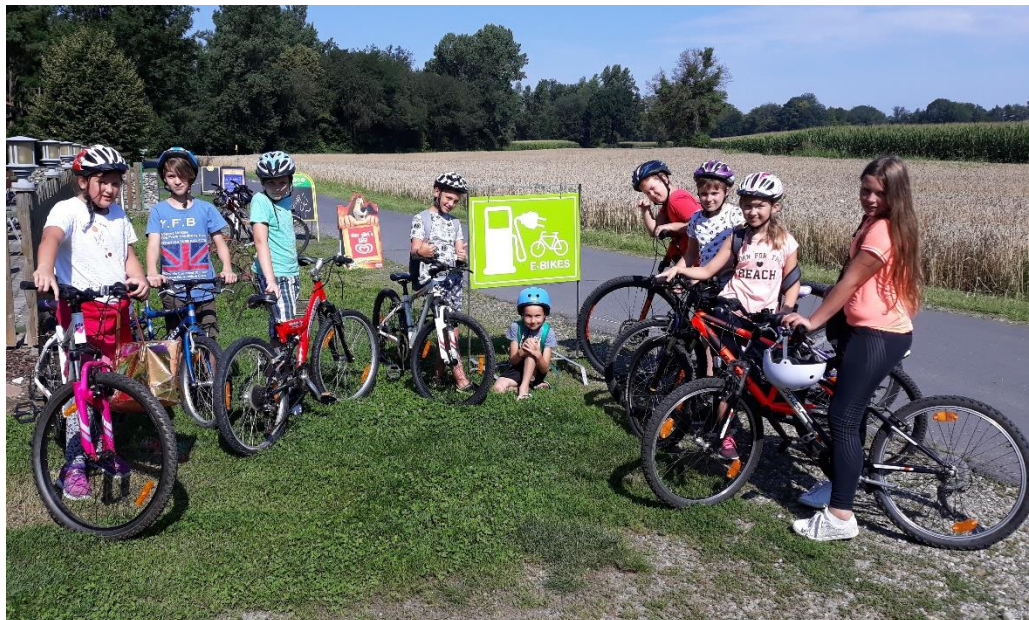
Slika 5: Športno-izobraževalni tabor Mureck 2018

letošnjem šolskem letu smo načrtovali takšen tabor, ki pa ga nam zaradi izbruha virusa COVID-19 žal ne bo uspelo uresničiti. Taborne želimo ohraniti tudi po izteku projekta POŠ, saj je zanimanje zanje zelo visoko.