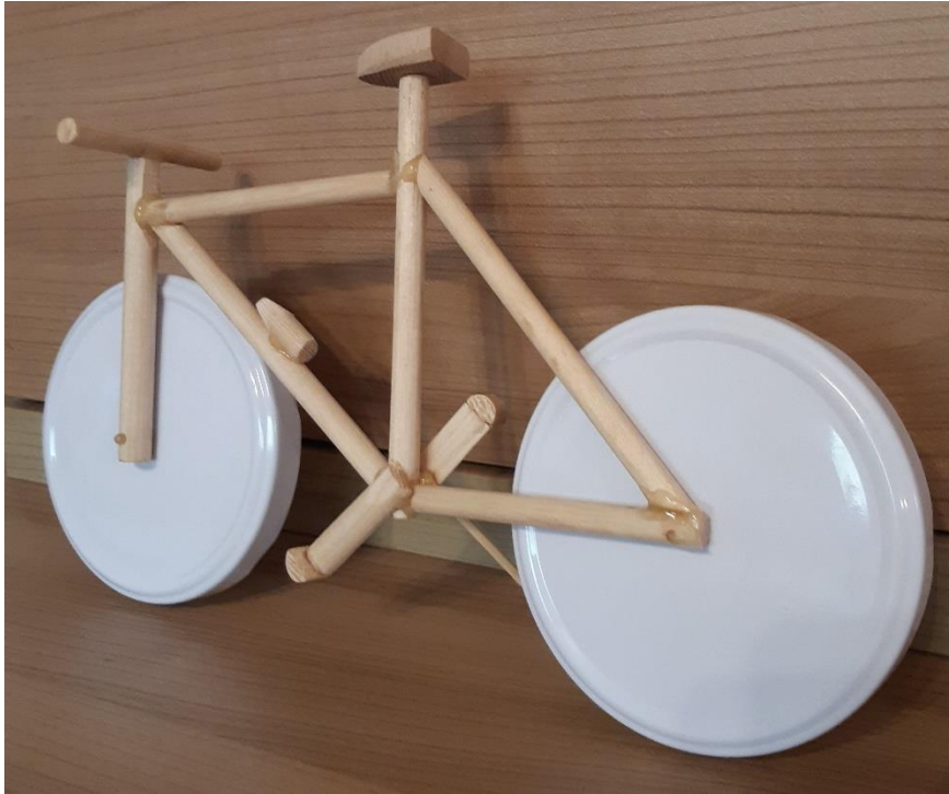
Slika 8: Kolo prihodnosti? (avtorica Kristina Vavh, arhiv šole)