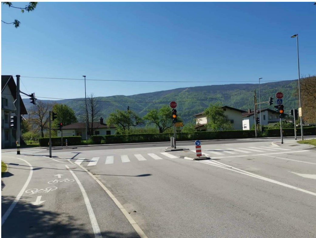
Slika 4: Kolesarska steza do avtobusne postaje pri šoli.