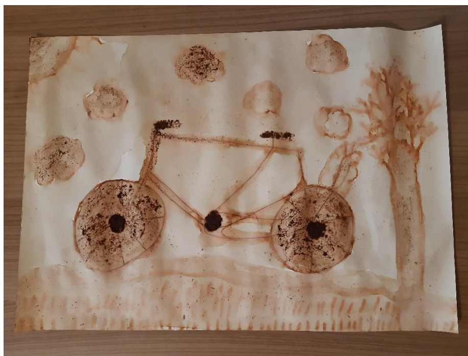
Slika 7: Kolesarjenje