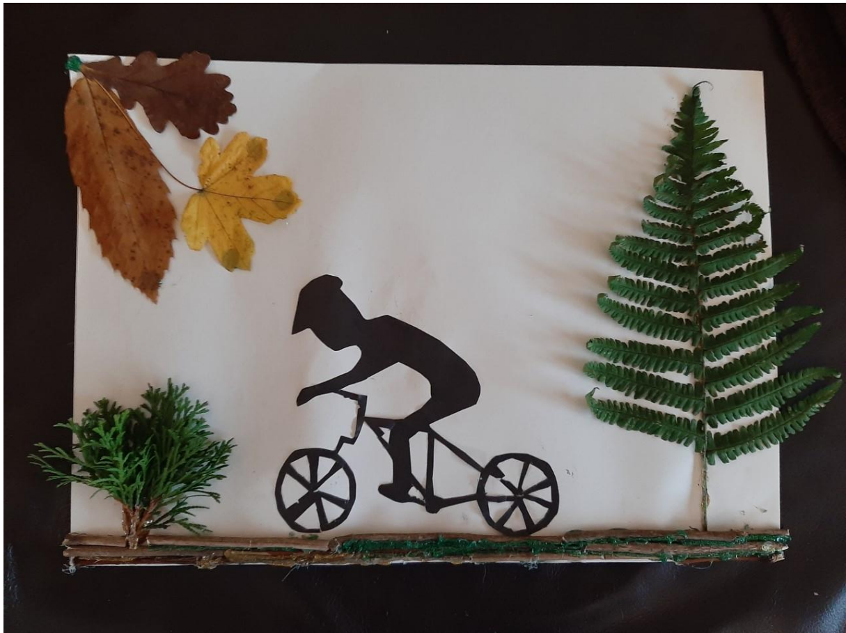
Slika 9: Kolesarjenje jeseni