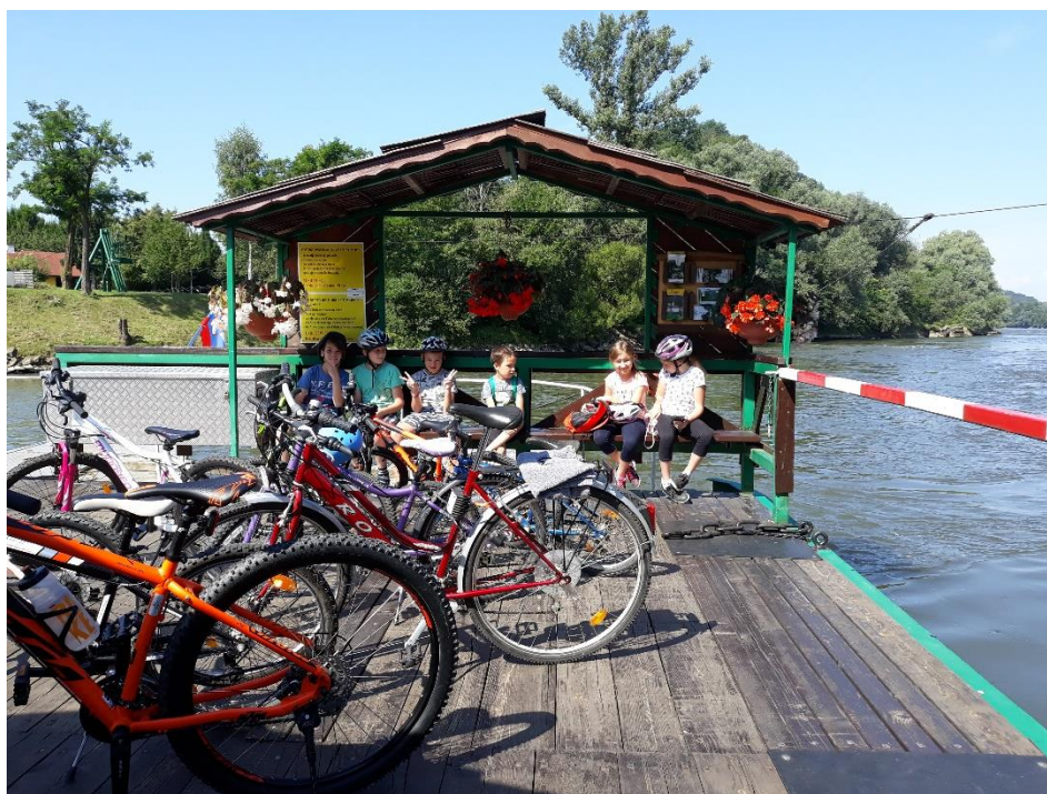
Slika 6: Selniški kolesarji na brodu čez Muro